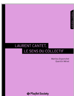
Laurent Cantet, le sens du collectif

Également chez Playlist Society dans la collection Face B - www.playlistsociety.fr