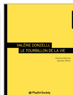
Valérie Donzelli, le tourbillon de la vie