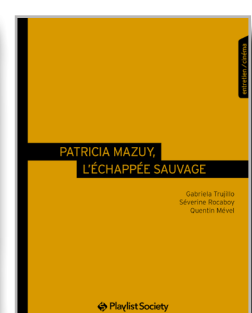
Patricia Mazuy, l'échappée sauvage